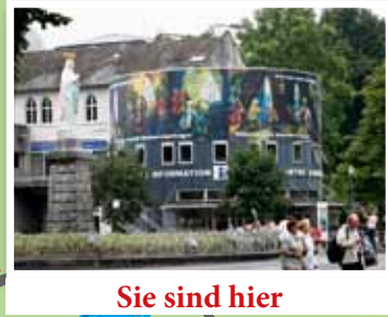
Sie sind hier