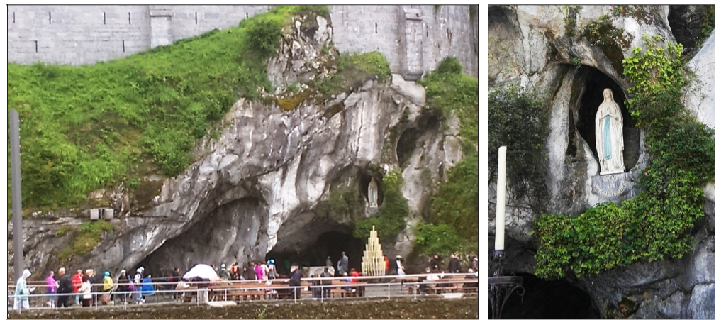
Ein beeindruckendes Gotteshaus ist die Rosenkranzbasilika aus dem Felsen, an deren Fuß die berühmte Marien-Grotte von Lourdes liegt.

wasser werden bis zu 2000 Besucher täglich eingeteilt – Frauen und Männer getrennt: außen, um die Menschenmassen in der Schlange zu kanali-